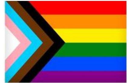
Drapeau de Fierté Inclusif

On ne peut pas parler de la Fierté sans parler de ses origines, même si c'est bref. Bon. Alors, on marque le début de la lutte contre l'homophobie, transphobie, biphobie en considérant les manifestations qui ont eu lieu en 1969, à New York, à Stonewall Inn. À cette époque, il y avait des lois homophobes, biphobe, transphobes qui interdisaient aux gens d'être lesbienne, gai, ou transgenre. Voilà où on a vu une série de manifestations contre un raid de la police. Violence. Dissidence publique. Émeutes. La communauté arc-en-ciel a monté cette série de protestations pour signaler qu'on en avait assez de la violence éprouvée aux mains de la police. C'est pour ça qu'on dit que la première Fierté était une émeute. Marsha P. Johnson et Sylvia Rivera étaient des activistes trans impliquées, on sein de la naissance du mouvement. Leurs histoires valent la peine d'étudier, si tu es curieuse et veux une histoire spécifique à explorer.